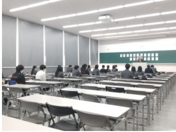
壮行式（前日）の様子

在校生応援団による迫力ある演舞、生徒会による力強い書道パフォーマンス、そして在校生代表からの心のこもった熱い応援メッセージと、心に響く催しが続きました。参加した生徒・保護者・職員全員が一体となり、38回生に大きなエールを送りました。