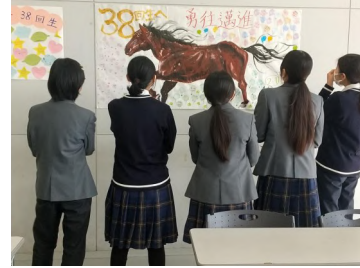
出発式（当日朝）の様子