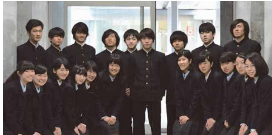
「和～岩田生の繋がり～」をキャッチフレーズに活動する30年度生徒会メンバー