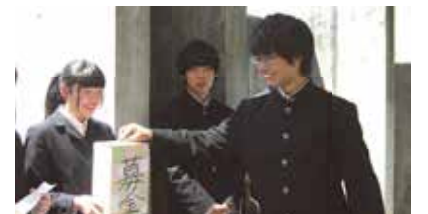
街頭あしなが学生募金活動など、校外での活動も生徒会執行部が中心となり積極的に行っています。