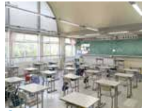
D 5号館 / 教室(中3・高1・2)