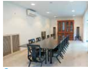
F 7号館 / 会議室