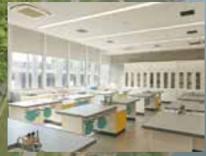
C 3号館 / 理科実験室・講義室・図書室・ITルーム