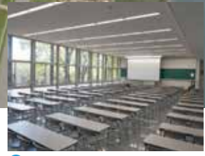
E 4号館 / 教室(高3・APU)・進路指導室・講義室(大中)・学校事務室