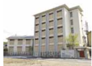
女子寮 Maison de Lune ※学校から2.5km離れた場所にあります。

ACCESS JR大分駅 下車 ⇒ 大分バス—鶴崎方面行き—「舞鶴橋」下車(約15分) 大分バス—岩田循環—「岩田学園前」下車(約20分) JR牧駅 下車 ⇒ 徒歩約10分