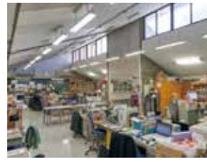
B 2号館 / 校長室・職員室・相談室