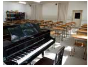
I 6号館 / 調理室・被服室・美術室・音楽室