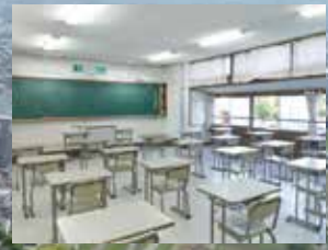
A 1号館 / 教室(中1・2)